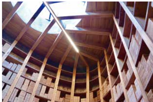
▲曲線が美しい木材あらわしの天井