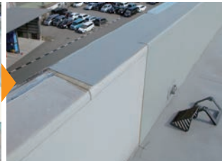
▲パラペットも既存シートの上に平滑に接着工法で施工した