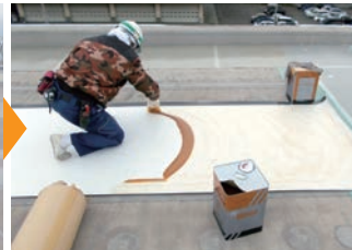
▲既存シート表面と新規シート裏面に接着剤を全面塗布