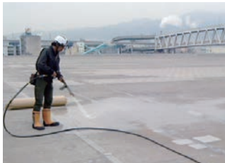
▲既存塩ビシートの汚れを洗浄