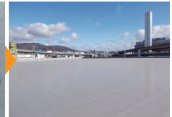
▲全面接着工法だから作業音も抑制でき、スムーズに改修施工を完了