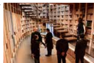
▲ショールーム内部

木質建材の開発・販売を手がける株式会社マルホンの九州初となるショールーム。吹き抜けの壁一面に商品サンプルが並ぶ。森林の持続可能性に配慮し製材された木材のみを用いた環境配慮型の建物として、国内でも