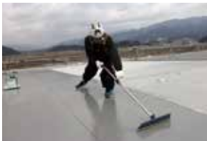
▲大屋根は接着工法で施工