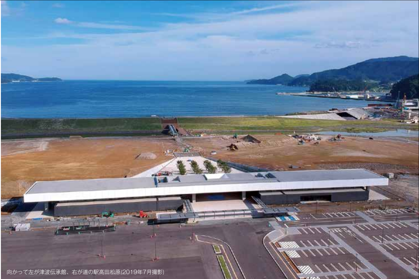
向かって左が津波伝承館、右が道の駅高田松原(2019年7月撮影)