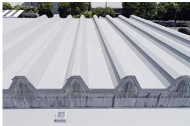
▲トップライトまわりもすべてシートで改修

所在地 神奈川県藤沢市 仕様・規模 SD-1仕様(NBP-227D UD) 約5,600㎡ 元請負人 株式会社オオニシ住建 防水施工 マルミ産業株式会社 施工協力 株式会社ジョールーフ 施工期間 2019年1月～3月