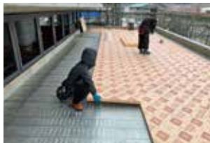
▲下屋はSD-F高断熱仕様を採用