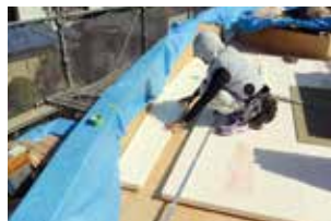
▲木質下地に断熱材を敷設