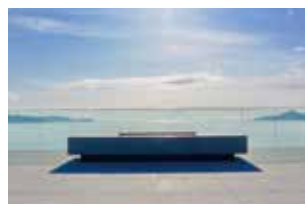
▲献花台が備えられた「海を望む場」