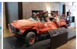
▲伝承館内の展示スペース

所在地 岩手県陸前高田市 仕様・規模 下屋部：SD-F仕様 (NBP-222 UD) 約1,200㎡ 屋上部：NBP-110 約3,000㎡ 設計者 株式会社ブレイク研究所・ 株式会社内藤廣建築設計事務所設計共同体 元請負人 西松建設株式会社 防水施工 株式会社青建防水工業 施工期間 2019年1月～4月